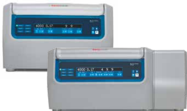
SL4 Plus и SL4R Plus

Широкий модельный ряд настольных центрифуг Thermo Scientific™ серии SL позволяет использовать оборудование в лабораториях различной производительности. Небольшие лаборатории могут быть заинтересованы в центрифугах SL8/SL8R, укомплектованных горизонтальным ротором TX-150 (4 x 145 мл), позволяющим одновременно центрифугировать 24 пробирки (вакутейнера) объемом 5/7 мл. Центрифуги повышенной производительности (модели SL4 Plus / SL4R Plus) будут востребованы в биотехнологических и научно-исследовательских лабораториях, т.к. предназначены для одновременного центрифугирования 4 л образца или большого количества пробирок (напр., 40 конических пробирок объемом 50 мл).