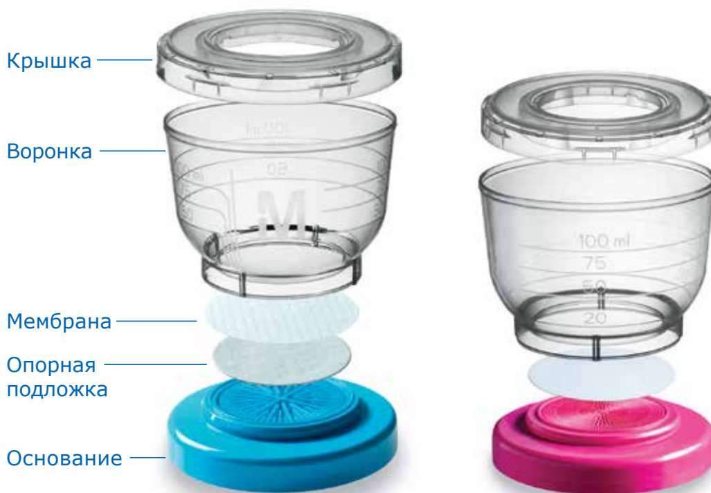
Компоненты фильтрационного устройства EZ-Fit™

Готовые к использованию фильтрационные устройства для определения числа микроорганизмов