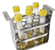
TR-16/19 BS-010406-FK штатив

Штатив для пробирок \varnothing 30 мм, емкость 5 пробирок. ШхГхВ: 155x90x112 мм