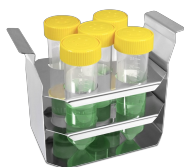
TR-5/30 BS-010406-КК штатив

Штатив для пробирок \varnothing 30 мм, емкость 5 пробирок. ШхГхВ: 155x90x112 мм