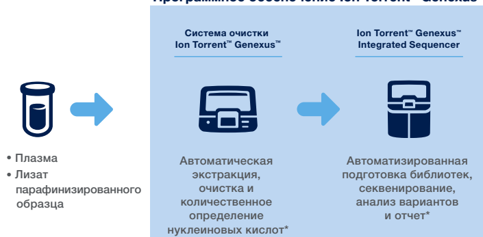
Рис 1. Автоматизация NGS от образца до отчета за один день.