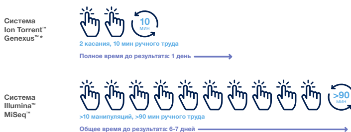
Рис 2: Минимальное время ручного труда и времени пробега при работе пользователя с системой Genexus.