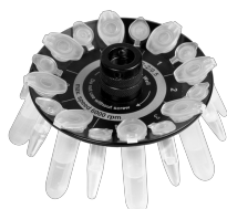
R-2/0.5 BS-010205-CK ротор

Ротор для 8 x 2/1.5 мл и 8 x 0.5 мл пробирок