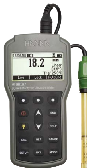
В комплекте электрод, проточная ячейка, калибровочный раствор, ПО, USB-кабель и батарейки