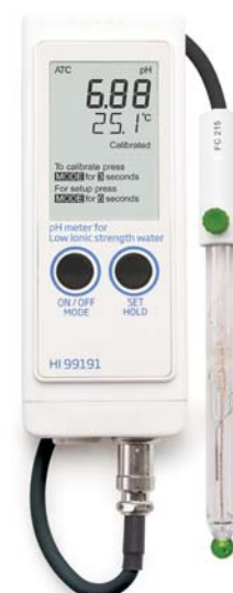
В комплекте электрод, раствор для очистки, электролит, буферные растворы и батарейки

Двойная система сравнения хорошо служит в образцах с низкой ионной силой, а три диафрагмы обеспечат большой поток электролита, необходимый для получения стабильных результатов.