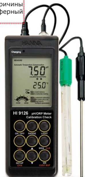
В комплекте с электродом, буферными растворами и батарейками