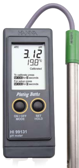
В комплекте электрод, раствор для очистки, буферные растворы и батарейки