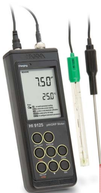
В комплекте с электродом, буферными растворами и батарейками