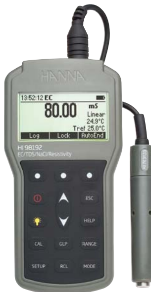
В комплекте электрод, калибровочный раствор, ПО, USB-кабель и батарейки

Предусмотрено создание до 10 профилей измерений, содержащих настраиваемые параметры: компенсацию температуры, диапазон измерений, фактор TDS.