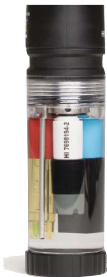
Сенсоры внутри защитной калибровочной емкости

Приборы поставляются в кейсе с принадлежностями, с датчиком и сенсорами, в комплект поставки входит программное обеспечение для связи с компьютером и micro-USB кабель.