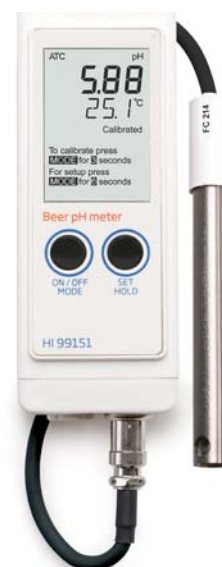
В комплекте электрод, раствор для очистки, буферные растворы и батарейки

Поскольку продукты пивоварения загрязняют диафрагму и практически не удаляются с нее, электрод имеет обновляемую тканевую диафрагму. Для обновления следует вытянуть диафрагму на пару миллиметров