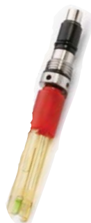
Сенсор pH и ОВП

Датчик имеет гнезда с цветовым кодированием для каждого сенсора. Пустые гнезда закрываются заглушкой для защиты от попадания влаги