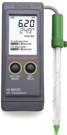
В комплекте электрод, бур, раствор для экстракции, для очистки, буферные растворы и батарейки

Существует множество ситуаций, когда универсальный прибор — не лучшее решение. Специальные датчики, разработанные с учетом свойств сложного образца — высокой температуры, присутствия нерастворимых частиц или белка, низкой ионной силы, позволяют получить намного более точный результат. Конструкция обеспечивает большой срок службы электрода и правильность показаний по сравнению с рН-метрами общего назначения.