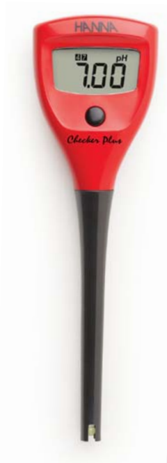
В комплекте с электродом и батарейками

Часто требуется недорогой и компактный, простой в работе прибор. Такой, который не требует от пользователя специальных навыков, который не нужно подключать к компьютеру, для которого не нужно тщательно подбирать аксессуары. Карманные приборы — лучший выбор.