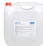
PDS-10L BS-040107-FK раствор для дезактивации ДНК/РНК 10л Раствор для дезактивации ДНК/РНК.