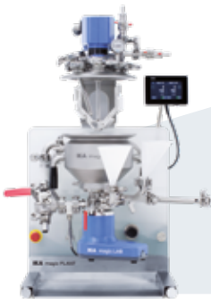
magic PLANT inline