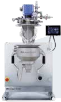
magic PLANT basic