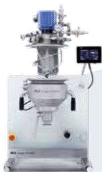
magic PLANT powder