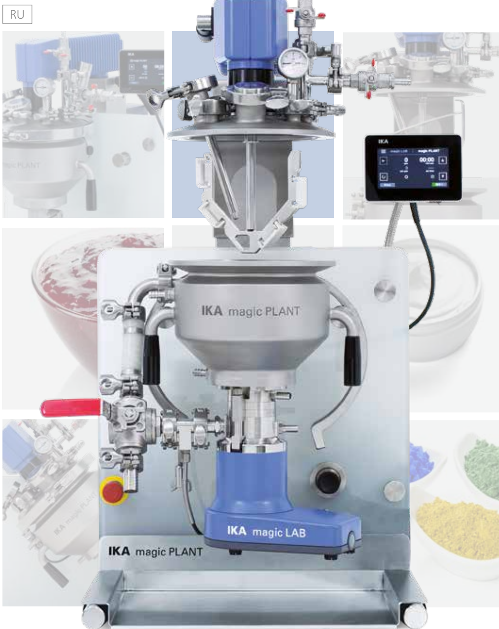
МОДУЛЬНАЯ ТЕХНОЛОГИЧЕСКАЯ УСТАНОВКА ЛАБОРАТОРНОГО МАСШТАБА Установка magic PLANT от IKA