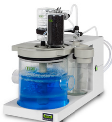
Scrubber К-415 Нейтрализация