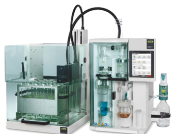
KjelMaster System К-375 / К-376 / К-377 Паровая дистилляция, титрование и автоподача