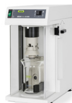
Mixer В-400 Измельчение и гомогенизация