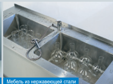
Мебель из нержавеющей стали