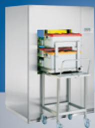
Большой паровой стерилизатор 73–1490 л