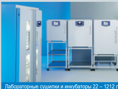
Лабораторные сушилки и инкубаторы 22 – 1212 л