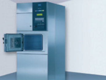
Формальдегидный стерилизатор 110 л