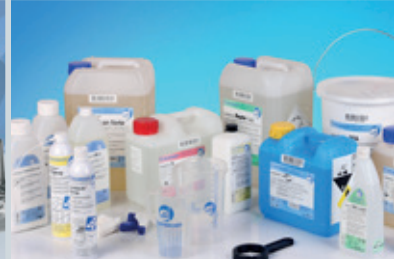
Средства для чистки и дезинфекции