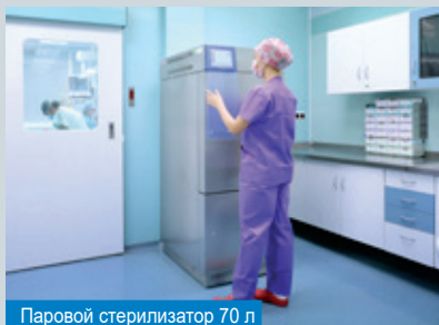
Паровой стерилизатор 70 л